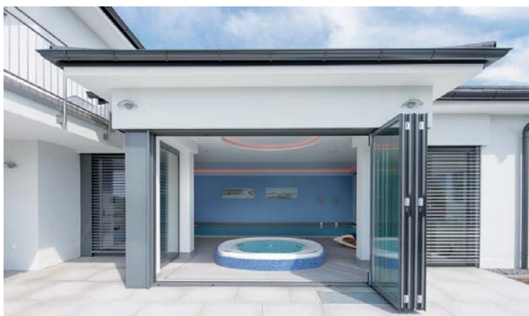
Bild unten Auch der Blick von außen lohnt sich: Die harmonische Komposition aus Whirlpool und Schwimmbad begeistert.