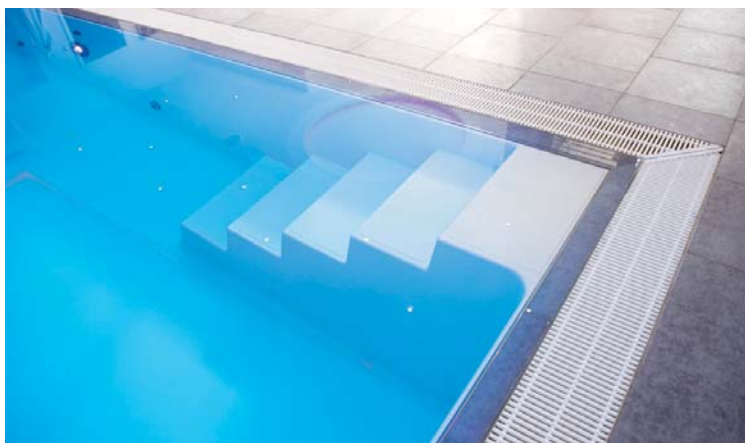
Bild oben Die dezente Treppe zum Einstieg fällt kaum ins Auge.

• Viel Glas und eine gerade Linienführung schaffen Offenheit und Weite.