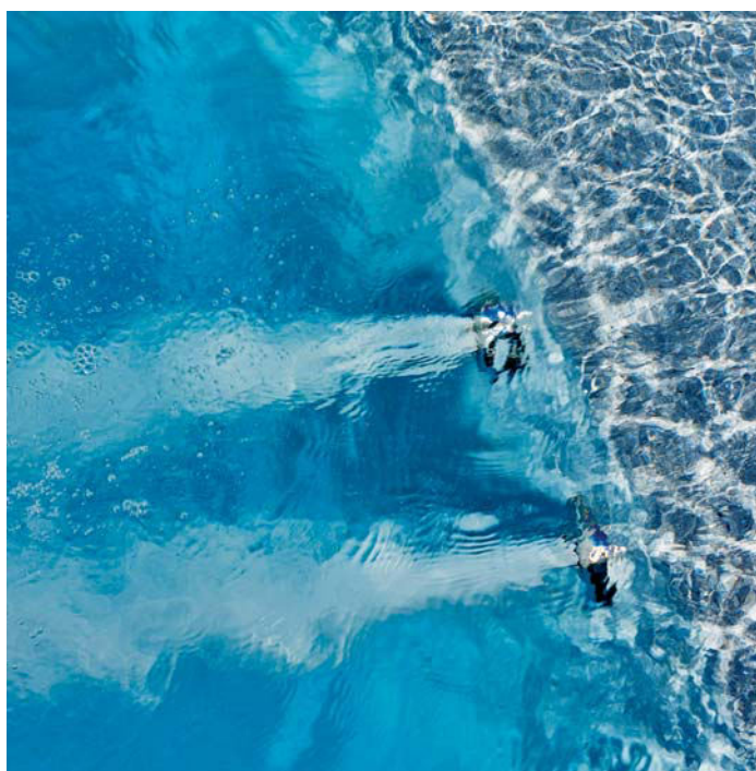
Bild unten An der Stirnseite des Pools befindet sich eine kraftvolle Gegenstromanlage, die bestes Schwimmtraining garantiert.

Bild oben Das schlanke Becken bietet mit mehr als elf Meter Länge Platz zum Schwimmen, Sonnen und Ausspannen.