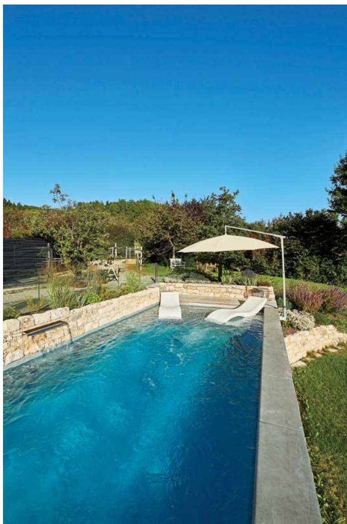
Bild linke Seite Auf der Sonnenseite: Die Ausrichtung des Pools ist ideal, um ein Maximum an Sonneneinstrahlung genießen zu können.

Bild oben Das schlanke Becken bietet mit mehr als elf Meter Länge Platz zum Schwimmen, Sonnen und Ausspannen.