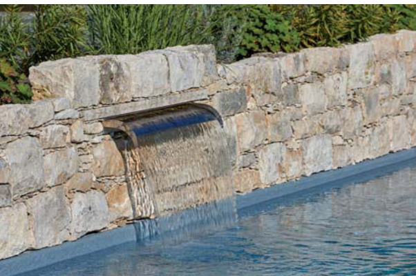
Bild oben Wenn das Schwimmbad einmal nicht in Betrieb ist, fährt eine Solar-Unterflurrollladenabdeckung aus, die vor Schmutz und Wärmeverlust schützt.

IN KÜRZE Dort wohnen, wo andere Urlaub machen. Die Bauherren, deren Anwesen am Bodensee der Familienmittelpunkt ist, fehlte zum perfekten Holiday-Feeling nur noch eines: der eigene Pool hinter dem Haus. Das sich harmonisch in die Hanglage einfügende Becken trumpft optisch mit Natursteineinfassung, großer Flachwasserzone und vollautomatischer Schwimmbadtechnik. Dem Urlaub zu Hause steht jetzt nichts mehr im Weg.